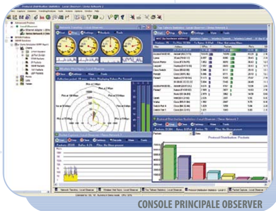
CONSOLE PRINCIPALE OBSERVER