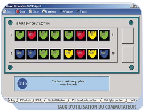
TAUX D'UTILISATION DU COMMUTATEUR